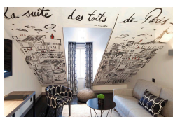
Suite des toits de Paris

32 chambres à partir de 125€/nuit et 1 suite à partir de 241€